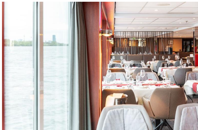
MS Nestroy, Restaurant

In der Früh erreicht unser Schiff Wien. Nach dem Frühstück an Bord verabschieden wir uns von den Gästen, die in Wien aussteigen. Danach schippert die MS Nestroy schließlich flussaufwärts ihrem Zielhafen Linz entgegen.