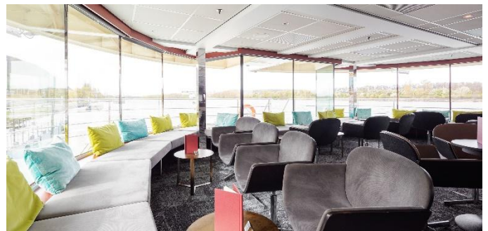
MS Nestroy, Panoramabar