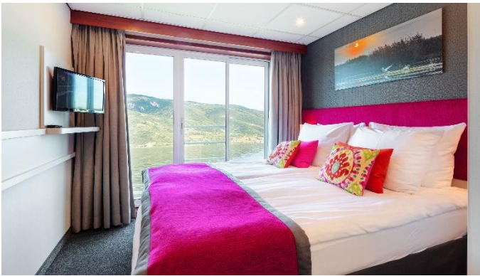
MS Nestroy, Doppelkabine Schiller- / Goethedeck

Änderungen des Reiseverlaufs und Ausflugsprogramm bleiben seitens der Reederei vorbehalten. Bitte beachten Sie, dass es aufgrund von Niedrig-/Hochwasser, zu unvorhergesehenen Wartezeiten bei den Schleusen oder auch aufgrund von Witterungsbedingungen zu Verspätungen und daher zu Änderungen des Ausflugsprogramms oder ev. auch der Ein-/Ausstiegstellen kommen kann. Ebenso behält sich die Reederei das Recht vor, die Gäste, insbesondere infolge von Niedrig-/Hochwasser oder Schiffsdefekt, alternativ zu befördern bzw. unterzubringen (z.B. mit Bussen bzw. in Hotels) und allenfalls den Streckenverlauf zu ändern; unter Umständen ist auch der Umstieg auf ein anderes Schiff erforderlich.