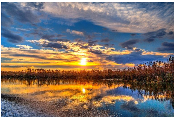
Donaudelta bei Sonnenuntergang