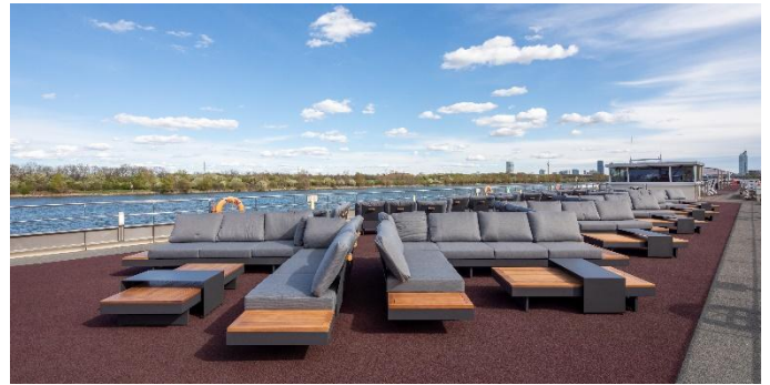
MS Nestroy, Lounge Observerdeck

Veranstalter: GSW Touristik AG; Bitte beachten Sie die Geschäftsbedingungen unter www.gta.at/geschaeftsbedingungen/